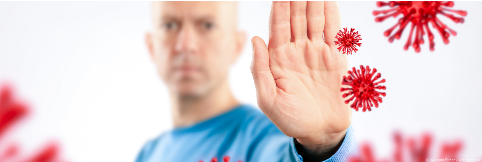
© Michael Stifter / Adobe Stock