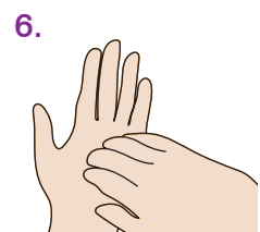
6. Kreisendes Reiben mit geschlossenen Fingerkuppen der rechten Hand in der linken Handfläche und umgekehrt.