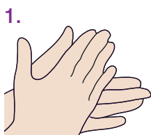
1. Handfläche auf Handfläche.