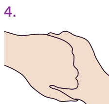
4. Außenseite der Finger auf gegenüberliegende Handflächen mit verschränkten Fingern.