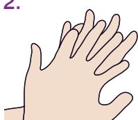
2. Rechte Handfläche über dem linken Handrücken und umgekehrt.