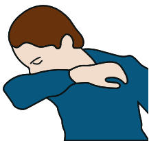
In die Armbeuge.