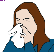
In ein Papiertaschentuch.