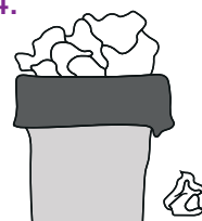
Taschentücher nicht herumliegen lassen.